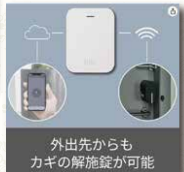
Qrio Hub を設置するとスマホで遠隔操作が可能