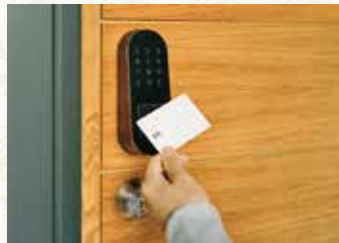
Qrio Pad を取り付けるとカードをかざして開錠できる