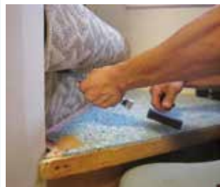
2段廻りは1段ずつ張る