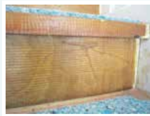
蹴込み板と段鼻には接着剤