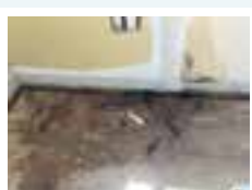
カーペットを剥がす