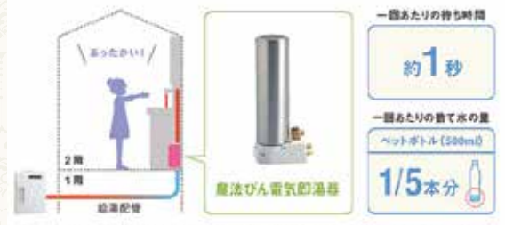
水栓金具の近くに即湯器を設置。1階からのお湯を待つことなく、すぐ使えて快適です。水もほとんど捨てることはありません。