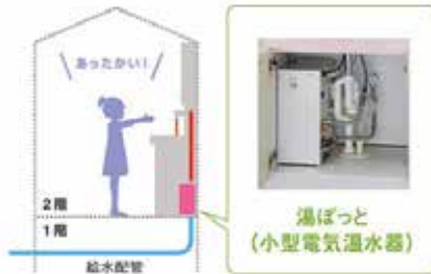
水栓金具の近くに小型電気温水器を設置。お湯が使えて快適です。

生活の中での困った場面はそれぞれですね。お客様にあったリフォームのご提案をさせていただきますので、お困り事はスタッフまでお気軽にご相談ください。