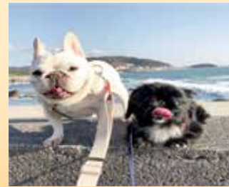
アクアとバジルも応援してるからね！