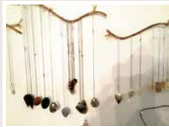
白蝶貝や黒蝶貝などのアクセサリー