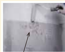
バルコニーに鉄製の物を置いていた部分が剥がれてきました。熱によってカサブタになってから剥がれたようです。