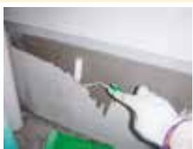
築25年のお宅の基礎。雨染みが出ています。アクアシールを塗布。