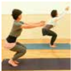
身体が前に傾きすぎ↑で、おしりが出ます

腹部が引き上げられるので、内臓機能も整うそうですよ。まっすぐ立った姿勢から膝を曲げて腰を後ろに落とします。膝はつま先よりも前に出ないように曲げ、身体は前に倒れ過ぎないように上に引き上げます。余裕があれば腿と床を並行に。つま先が外に向かないようまっすぐにし、腰が反らないよう恥骨をおへその方へ引き上げ、“骨盤を立たせる”のがポイントです。これがお手本 →