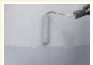
ケレン・トップ防水を2回塗りします。

※ 基礎コーティングのアクアシールは通常は建坪30で8万円前後、バルコニーのトップコーティングは6㎡までで6万円前後です(移動費別途)。