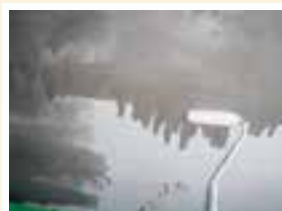
アクアシールを2回塗り。