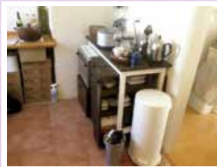
ご主人様作：手作りカップボード ワゴンが引き出せ、小物が取り出しやすいつくり