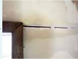
カッターで面取り