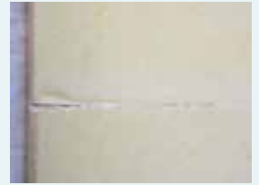
カッターで面取り