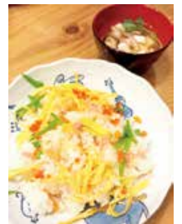
ひな祭りにちらし寿司を作りました♪