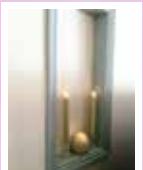
工事中にご夫婦で塗装されていた窓枠：リモコンで点灯するキャンドルは、夜になると映えそうですね