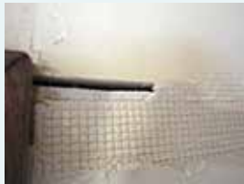
壁紙を剥がし、石膏ボードが見えました