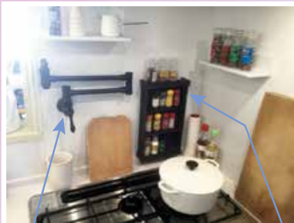
キッチンを設置した際に取り付けたポットフィルター（浄水器）